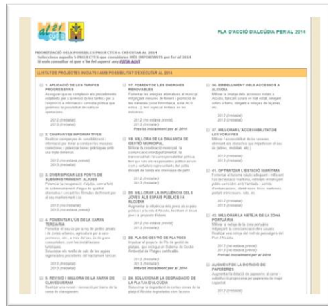
Captura de pantalla de l'enquesta online

Degut als canvis soferts al Pla d'Acció inicial 2012-2015, i com que s'han executat molts dels projectes previstos per als propers anys, es va habilitar entre el 10 de gener i el 14 de febrer de 2014 un canal online per a obrir la participació a la ciutadania i que els alcudienços proposessin i opinessin sobre quins projectes consideraven prioritaris per al municipi durant l'any 2014.